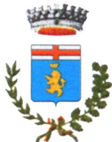
Comune di Vizzolo Predabissi